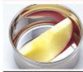
新鮮倉庫の場合 りんごの酸化比較実験