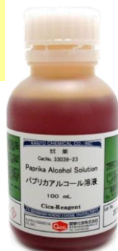
写真はパプリカアルコール溶液