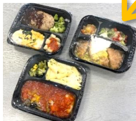
16×18cm以内の容器なら30個 18×24cm以内の容器なら20個