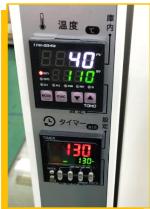
一目でわかる温度と時間

チルド(冷蔵)からフローズン(冷凍)へと変わる 新時代の介護食・給食のマストアイテム!