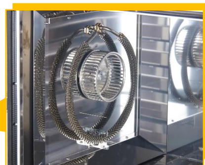
急速温風加熱方式で隅々まで温風を送ります