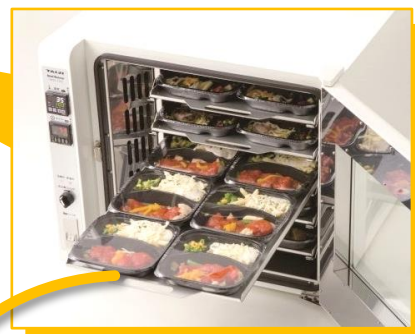
一度に20～30個の冷凍弁当が加熱可能