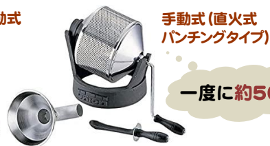
手動式(直火式 パンチングタイプ)